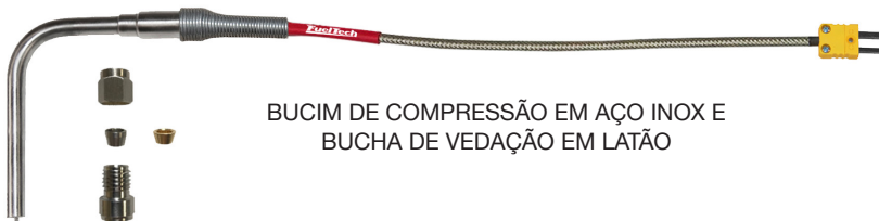
BUCIM DE COMPRESSÃO EM AÇO INOX E BUCHA DE VEDAÇÃO EM LATÃO